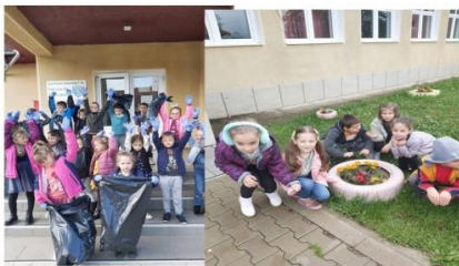
LECTIE DE EDUCAȚIE ECOLOGICĂ PLANTARE-ECOLOGIZARE