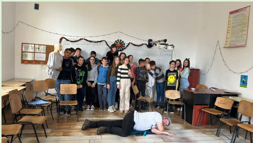
Lecție de prim ajutor