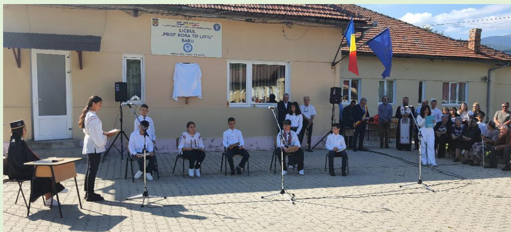
Piesa de teatru „O întâmplare adevărată”