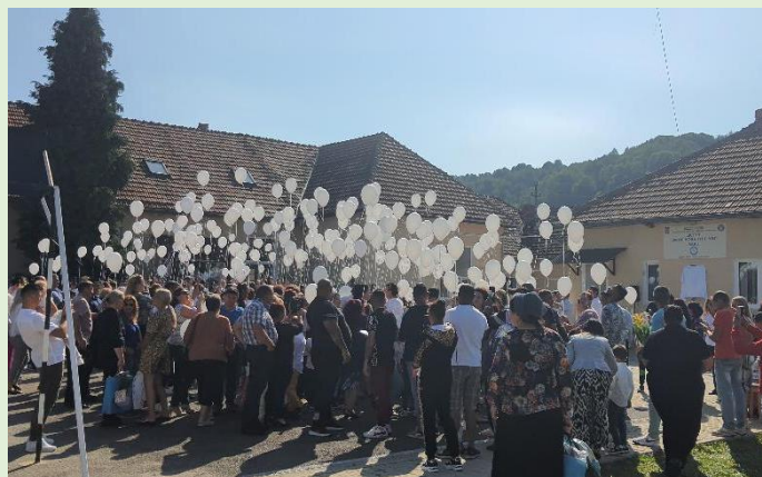
Festivitatea de deschidere a anului școlar 2023-2024