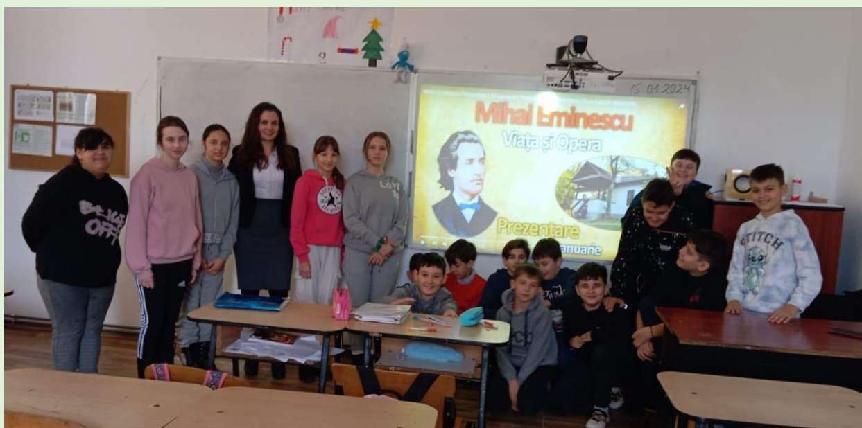
„Dor de Eminescu” – 15 ianuarie 2024