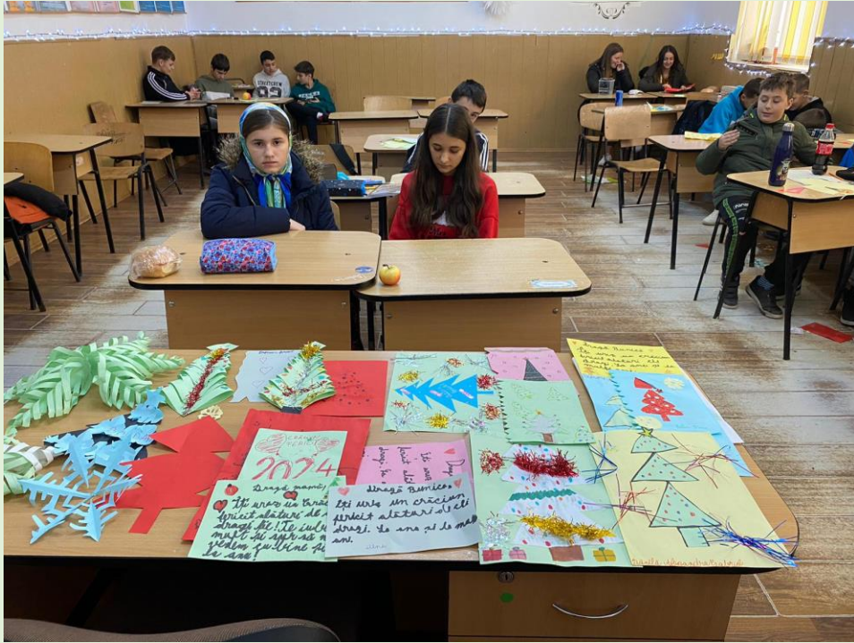
Felicitări și ornamente pentru Crăciun