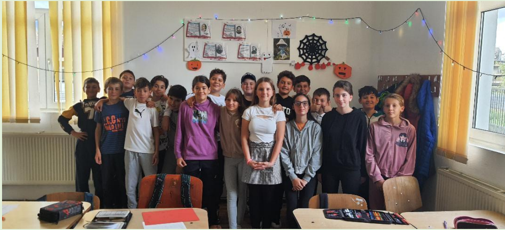
Halloween, 2023 – clasa a V-a