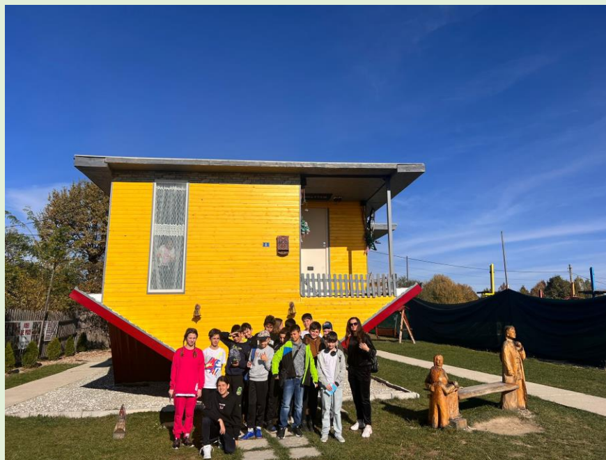
Castelul vrăjitoarelor – Bumbești-Pițic, Gorj