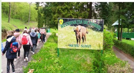
LECTIA DE EXPLORARE A MEDIULUI Rezervația de zimbrii-Hățeg