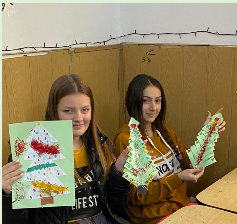
Ornamente pentru Crăciun