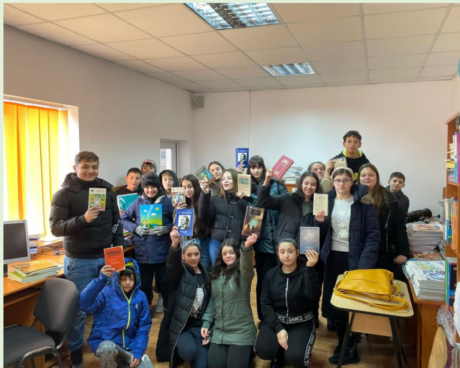
„Dor de Eminescu” – 15 ianuarie 2024